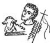
St. Johannes Baptist, Garrel