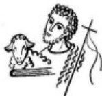
St. Johannes Baptist, Garrel